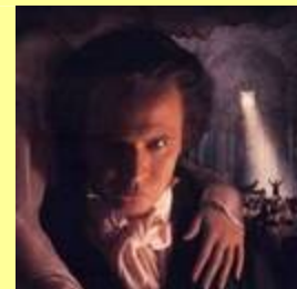
L.V. Beethoven, todo un rebelde

Haydn pasó treinta años al servicio del conde de Esterhazy, casi siempre sumiso, obligado a componer cualquier música que se le exigiera. Mozart estuvo al servicio del Arzobispo de Salzburgo, su ciudad natal, y tras ser despedido por su rebeldía, intentó vivir en Viena del éxito de sus obras, pero terminó muriendo en la pobreza. Beethoven fue el primero en romper totalmente con este sistema, nunca estuvo al servicio de ningún mecenas, y componía libremente para la posteridad. De manera que el músico se convertirá al final del periodo en un artista que vive de su arte, libremente, sin rendir cuentas a ningún patrón.